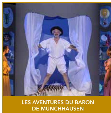
LES AVENTURES DU BARON DE MÜNCHHAUSEN

Musiques de Rameau, Campra, Grétry, Montéclair, Boismortier... Direction musicale Hervé Niquet Mise en scène et livret Patrice Thibaud Orchestre Le Concert Spirituel